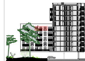
Façade jardin - Nord

ECH : 1:100 DATE : 09/04/2024 INDICE : 06